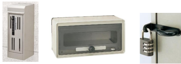
(写真は東洋エクステリアのポストの施錠の一例)

ポストのセキュリティとして、まず考えられるのは「鍵付きのポスト」。メーカーによって様々な商品がありますが、暗証番号を設定するタイプや数字を回して施錠・解錠できるダイヤルタイプ、南京錠を取り付けるタイプなどもあります。