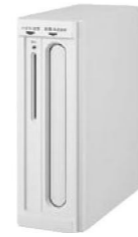
セキュリティ縦型ポスト (東洋エクステリア)

これは、郵便物が投函口から取り出されないように、大型の郵便物の投函口と、ハガキや封書用の小さな投函口とに分かれているもので、道路側から郵便物が取り出しにくくなっている商品などがあります。